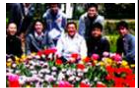
天の川河川敷花壇