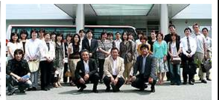
地域勉強会の様子