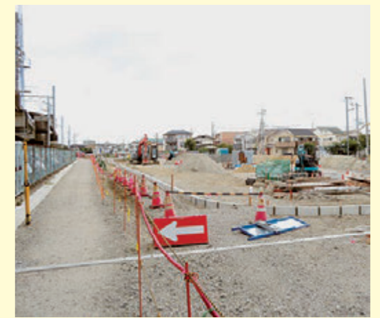
開発中のJR星田駅前北ロータリー

市の回答 今後、完成するJR星田駅前ロータリーについては、単なる電車とバス・タクシーの乗り継ぎだけでなく、第二京阪道路を生かし大阪の湾岸部や関西空港・伊丹空港など、より広域的な繋がりによりインバウンド・アウトバウンドを呼び込み、地域の活性化につながるよう進めていきたい。