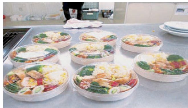
今回作成した七夕弁当

コロナ自粛による定例会中止が続いておりましたが、参加者のワクチン接種が完了したことで7月に第一回の定例会（臨時）を開催することができました。