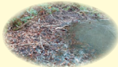
天野川の源流（生駒山麓公園付近）

交野市のシンボルである「天野川」を守るため、今後も市を越えた流域の団体とも力を合わせて、豊かな自然環境を次世代に繋げる活動を進めていきます。