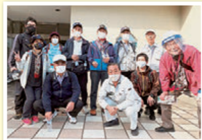
天の川を美しくする会のメンバーと