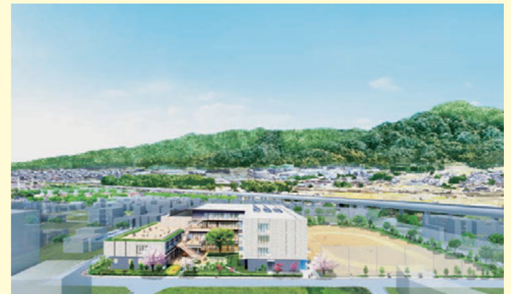
小中一貫校完成イメージ図（市HPより）