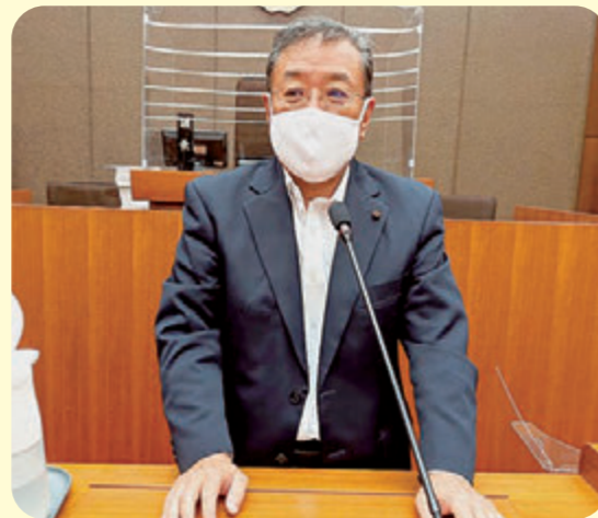
本会議での一般質問

しかし、小中一貫校の設置は交野市としても初めての取り組みであり、不安を感じておられる方も沢山おられます。議会としても、今後、重要テーマとして監視していくことが必要と考えます。