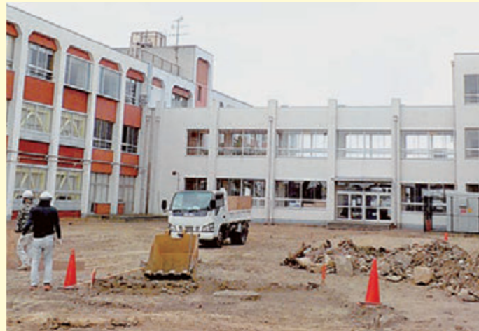
現在工事が進む長宝寺小学校

令和4年4月から工事がすすめられるため、現在の交野小学校の子どもたちは、来年4月からは長宝寺小学校に通うことになります。